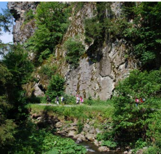
In der Steinachklamm

Die enorm vielfältigen und teils mehr als 500 Millionen Jahre alten Schichten des Westfrankenwaldes prägen den weiteren Verlauf des Weges. Gleich hinter dem uralten Bergbaustädtchen Kupferberg (Bergbaumuseum) öffnen sich gewaltige Steinbrüche, in denen Diabas abgebaut wird, ein dem Basalt sehr ähnliches Gestein. Auf einem Diabasfelsen steht auch Schloss Guttenberg , der Stammsitz der alten Adelsfamilie. Neben Staatssekretären und Ministern hat sie mit dem derzeitigen Familienoberhaupt Enoch zu Guttenberg einen weithin anerkannten Dirigenten und Umweltschützer hervorgebracht. In eines der schönsten Wiesentäler des Frankenwaldes malerisch eingebettet liegt das Etappenziel, die bewirtschaftete Neumühle im Steinachtal .