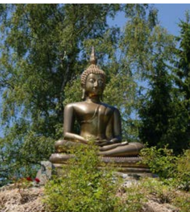
Buddha am Muttodaya-Waldkloster