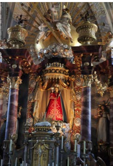
Wallfahrtskirche Marienweiher, Gnadenbild